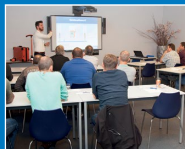
Seminars en workshops