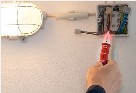
Testen van draden voor AC-spanning voor het snel lokaliseren van problemen