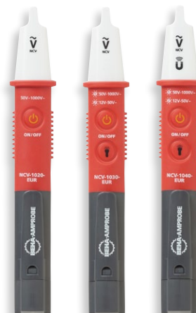
NCV-1000-EUR VOLTfix serie Contactloze spanningsmeetprobe

De Beha-Amprobe contactloze spanningstesters (NCV) NCV-1000-EUR VOLTfix serie (NCV) levert maximale veiligheid en gemak voor het detecteren van AC-spanning zonder elektrische systemen te onderbreken. Ontworpen om mee te nemen in het borstzakje van uw overhemd, presteert de NCV-1000-EUR VOLTfix zowel binnen als buiten. Veiligheid getest volgens de hoogste meetcategorie, CAT IV 1000 V, en ook IP65 water en stofdichtheid, is de NCV-1000-EUR VOLTfix geschikt voor de meest veeleisende industriële toepassingen.