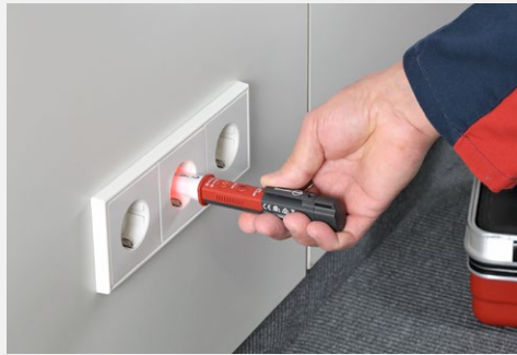
Testen van wandcontactdozen voor AC-spanning en polariteit